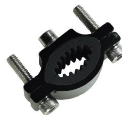
Boîtier en aluminium usiné (CNC)