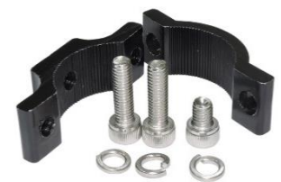
Support de montage en acier inoxydable